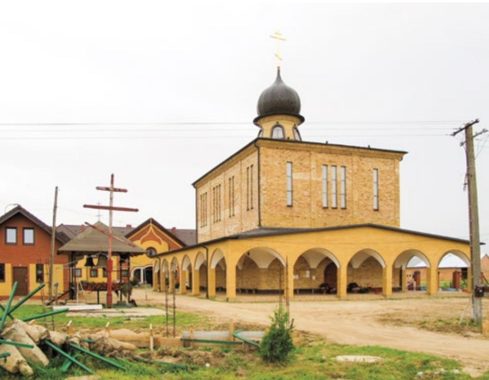
Церковь в честь святого мученика младенца Гавриила Белостокского Заблудовского монастыря Рождества Пресвятой Богородицы. Село Зверки (Польша)

В 1897 году для мощей младенца на добровольные пожертвования была изготовлена новая металлическая (серебряная или посеребренная) художественной работы рака с закрывающейся крышкой. В нее был вставлен окрашенный в белый цвет небольшой открытый гроб на подставке. В этот деревянный гроб был помещен еще один деревянный гроб, расписанный с внешней стороны изображениями пышных цветов. В передней части гроба лежала небольшая подушечка, обтянутая голубым шелком, а внизу шелковая подстилка. На них и покоились мощи младенца, облаченные в шелковую рубашечку. Ручки были открыты, они обхватывали лежащий на груди небольшой серебряный крест [17]. Вокруг раки и в раке всегда лежало много искусственных цветов — приношений паломников.