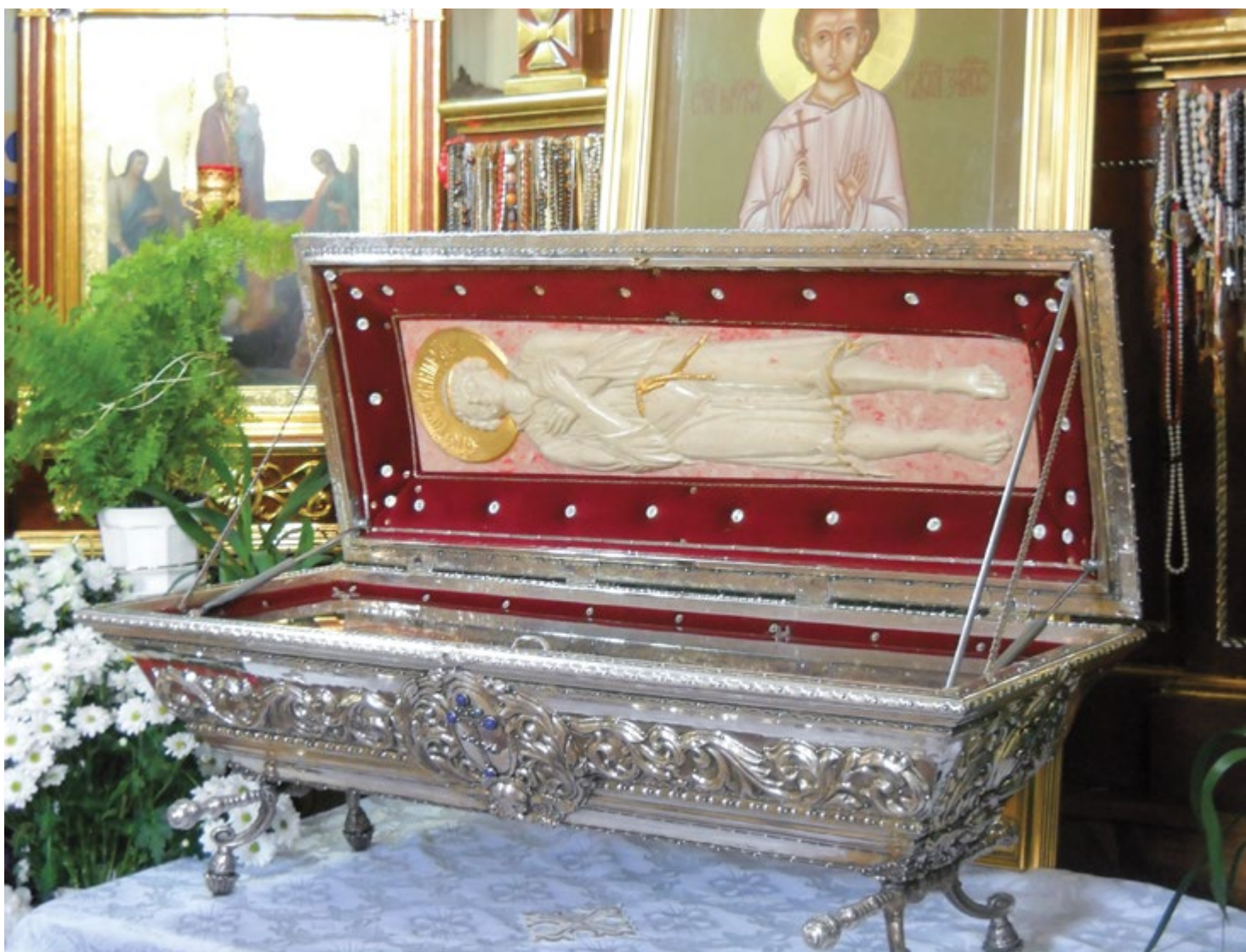
Рака с мощами святого мученика младенца Гавриила Белостокского

передать Горсовету «для использования в культурно-просветительских целях» [41]. Вместе с тем было решено «назначить авторитетную комиссию» для вскрытия находившихся в Троицком храме мощей младенца Гавриила Белостокского и княгини Софии Слуцкой, после чего передать их в Центральный Белорусский музей в городе Минске [42].