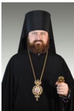
Епископ Слуцкий и Солигорский АНТОНИЙ , кандидат богословия

Имя святого младенца мученика Гавриила Белостокского, нетленные мощи которого почивают в Николаевском соборе города Белостока, хорошо известно православным верующим не только Польши, но и Беларуси, Украины, России. В литературе святой мученик Гавриил именуется Белостокским, Заблудовским и... Слуцким.