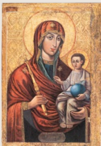
Икона Божией Матери «Минская» 13/26 августа Тропарь, глас 6:

Издается по благословию Высокопреосвященного Павла, митрополита Минского и Заславского, Патриаршего Экзарха всея Беларуси