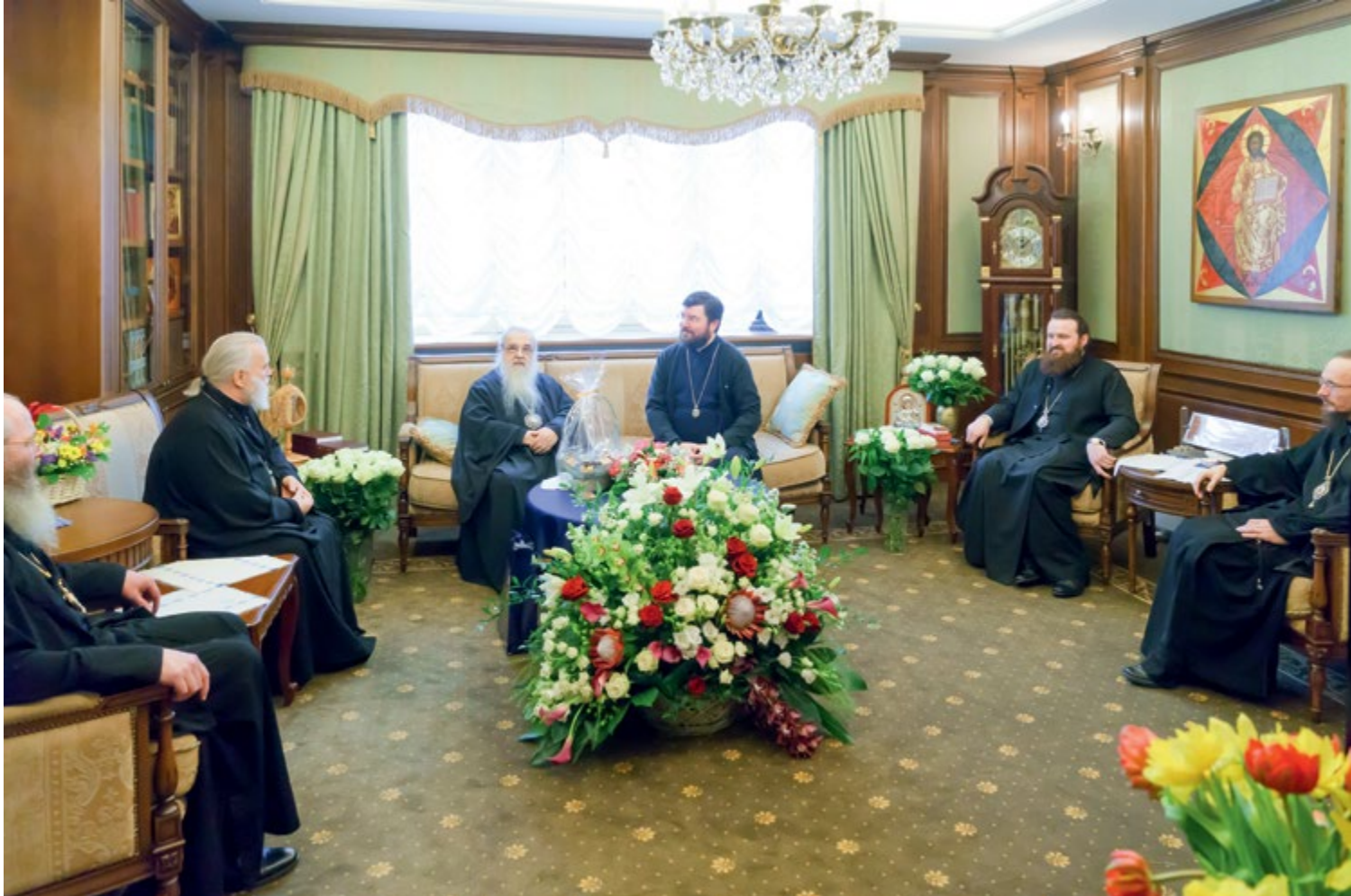
На фото сверху: Поздравление митрополита ФИЛАРЕТА, Почетного Патриаршего Экзарха всея Беларуси, с днем рождения. Минское епархиальное управление, 21 марта 2016 г.