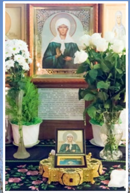
Ковчег с частицей мощей святой блаженной Матроны Московской