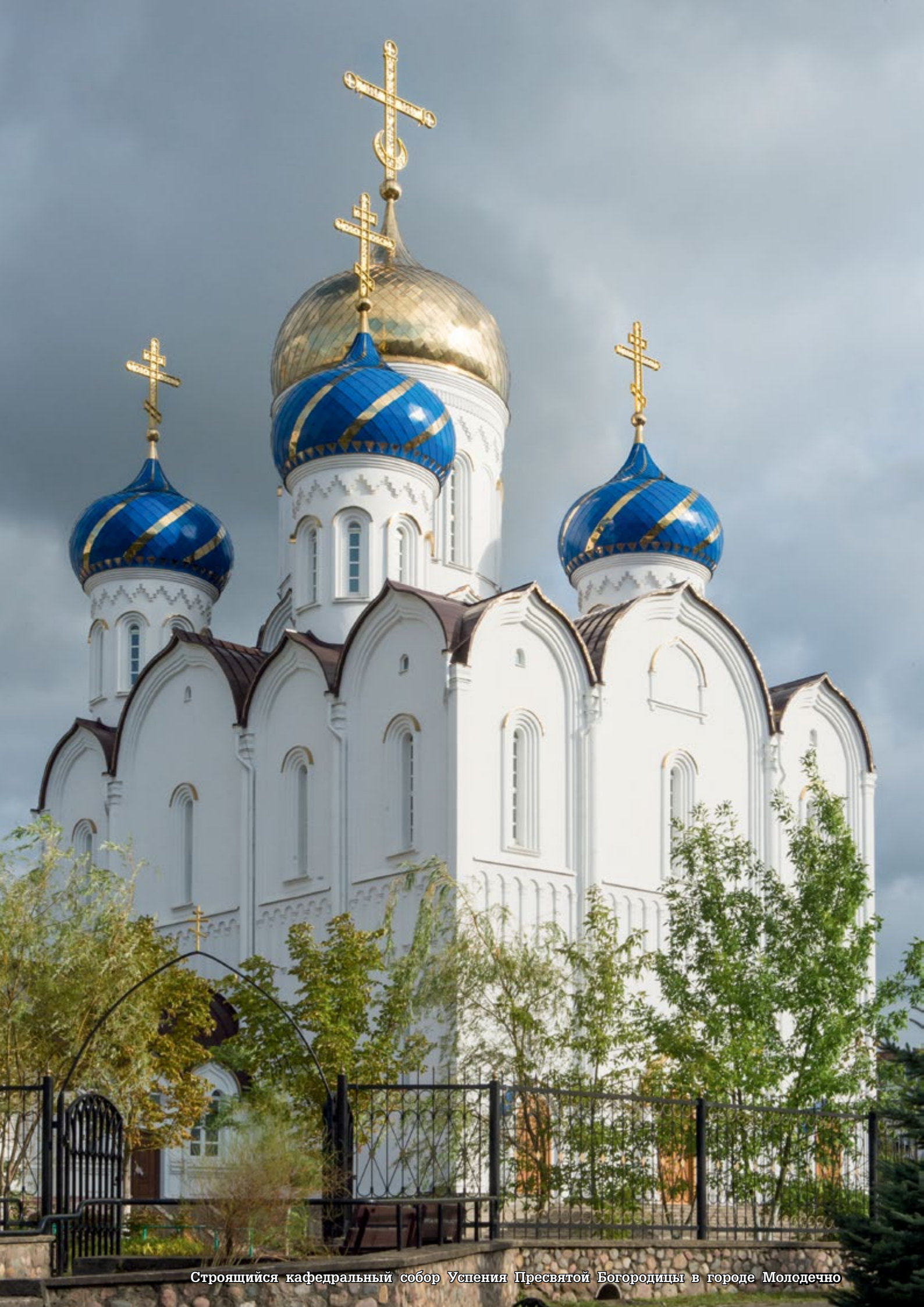
Строящийся кафедральный собор Успения Пресвятой Богородицы в городе Молодечно