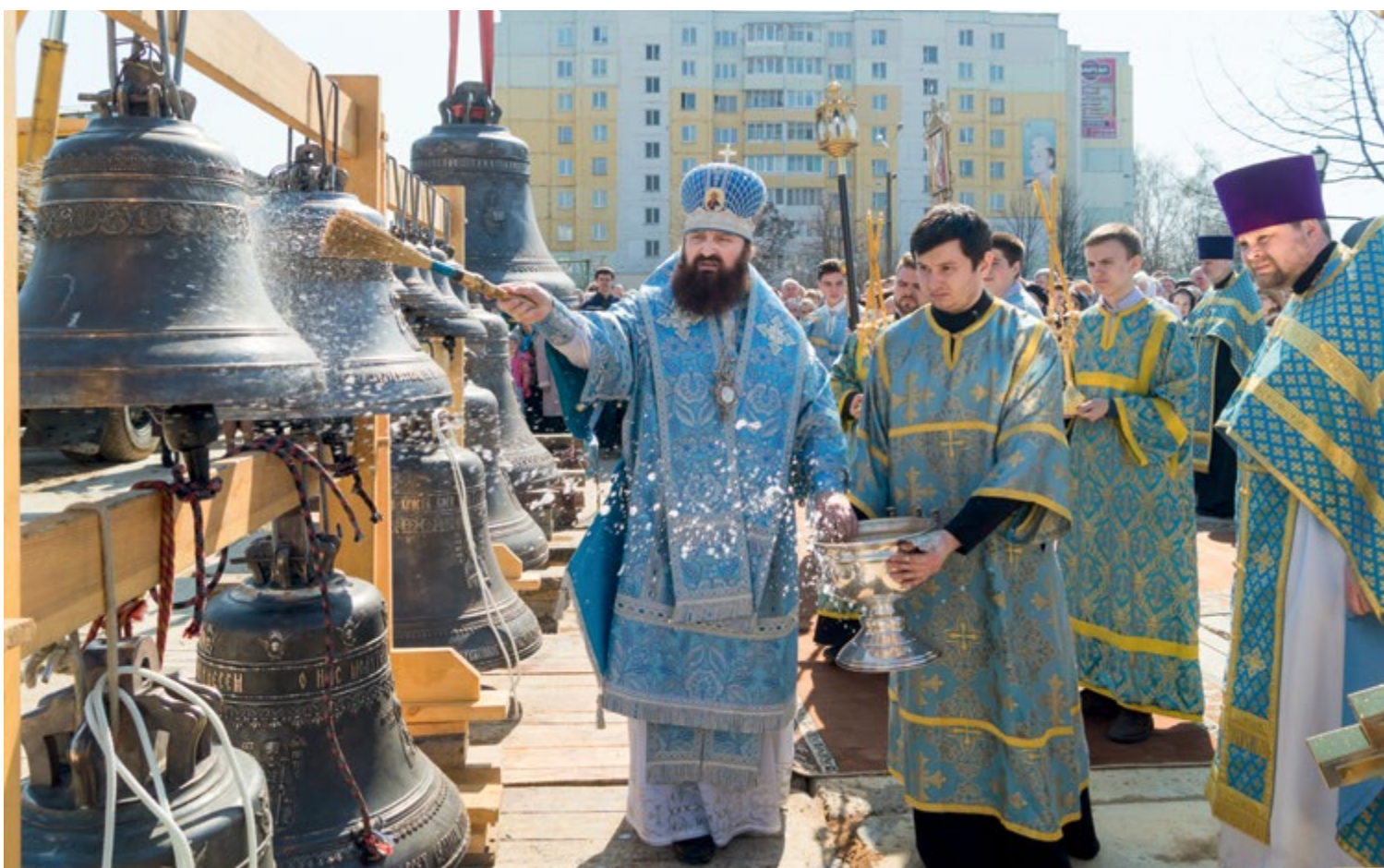
На фото внизу: Освящение колоколов для звонницы строящегося кафедрального собора Рождества Христова в городе Солигорске. 7 апреля 2016 г.