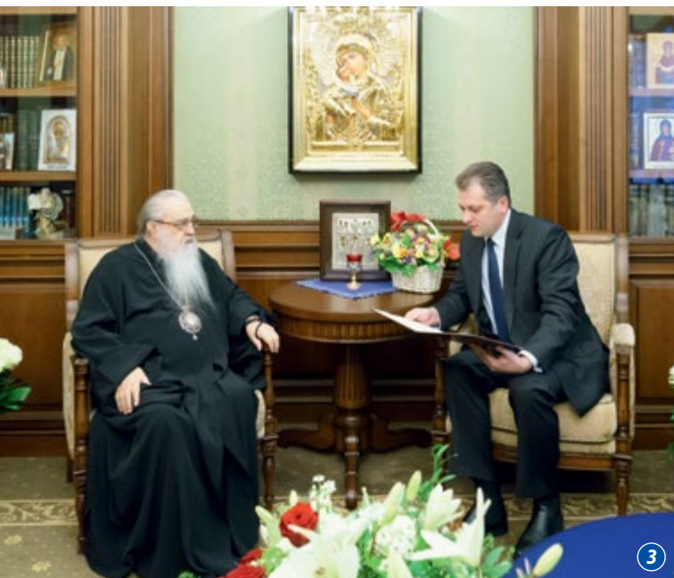
20 марта, воскресенье. Неделя 1-я Великого поста. Торжество Православия

Почетный Патриарший Экзарх всея Беларуси митрополит Филарет совершил Божественную литургию в домовом храме Минского епархиального управления в честь Собора Белорусских святых.