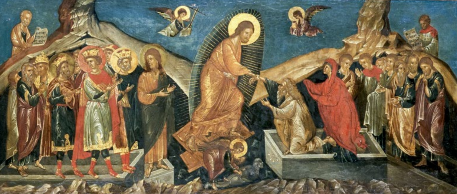
«Сошествие во ад». XVII век. Македония

Святейший Патриарх Московский и всея Руси Кирилл в одной из своих проповедей подчеркнул, что сегодня немало людей «стремится обрести подлинный смысл бытия, найти путь к Богу...» Чтобы Благая весть достигла и их, «голос Церкви должен звучать громко и убедительно, свидетельствуя о Том, Кто был «предан за грехи наши и воскрес для оправдания нашего» (Рим. 4: 25). Свидетельствуя о Христе Воскресшем и памятуя слова апостола: «Если вы воскресли со Христом, то ищите горнего, где Христос сидит одесную Бога» (Кол. 3: 1), поддержим друг друга, чтобы никто не чувствовал себя одиноким, униженным и унывающим. Разделим со всеми ближними и дальними радость о Воскресшем Спасителе, радость возможности единения с Ним. И тогда и в нас самих, и в окружающем мире мы увидим изменения к лучшему.