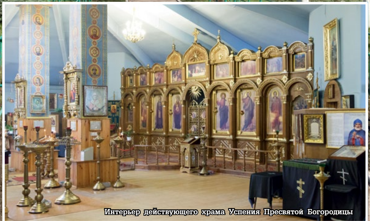
Интерьер действующего храма Успения Пресвятой Богородицы